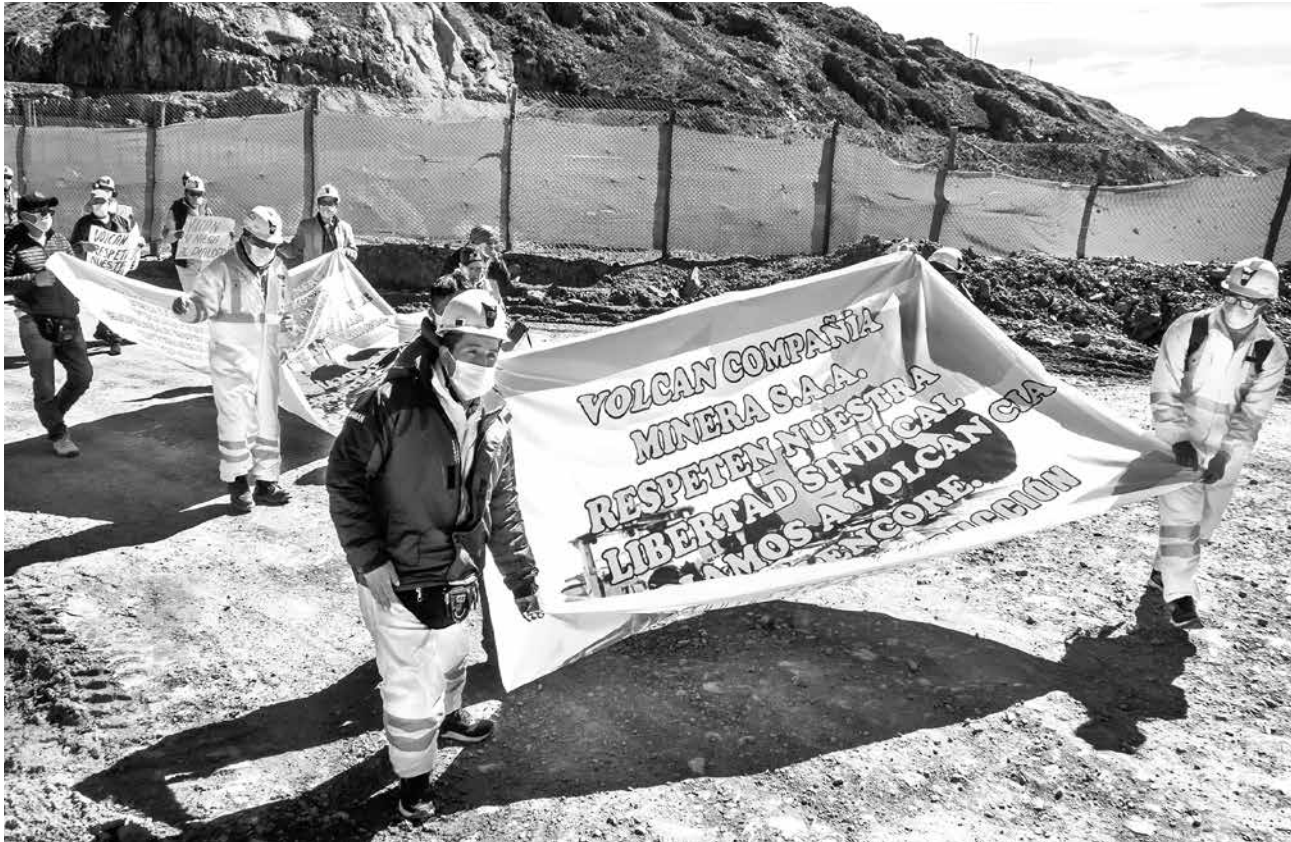
Streikende Minenarbeiter der Glencore-Tochergesellschaft Volcan in Andaychagua, Peru.