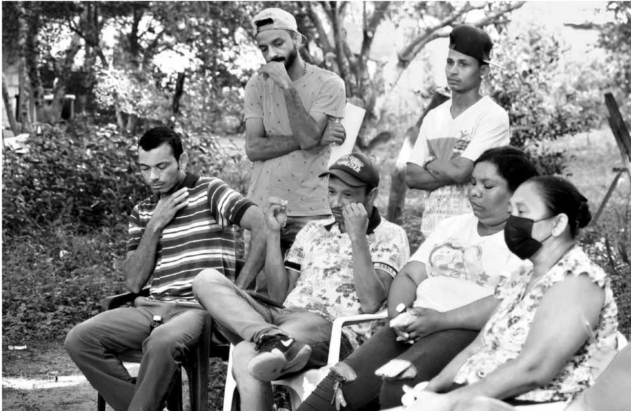
Dorfbewohner*innen in Kolumbien berichten von den Auswirkungen einer Glencore-Kohlemine auf ihren Alltag.